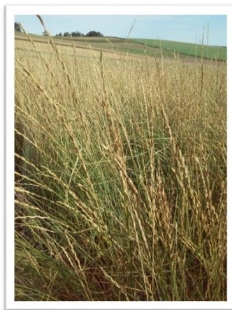
Fot. 5. Plantacja perzu wydłużonego BAMAR