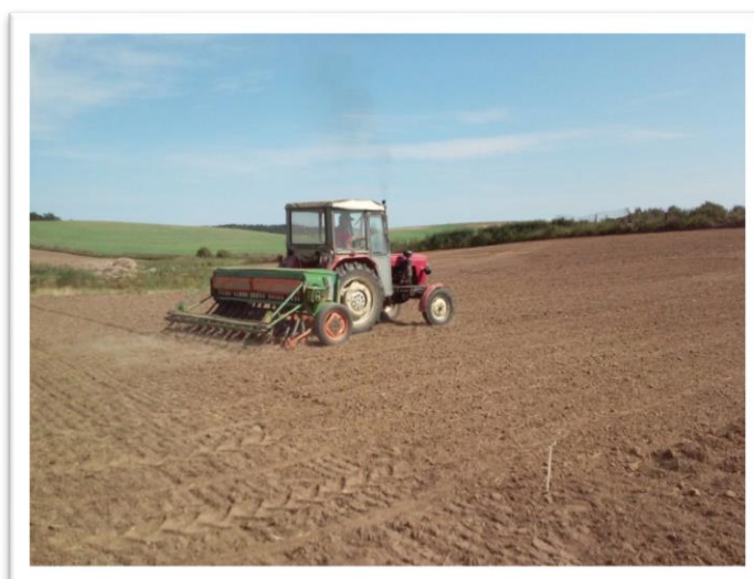
Fot. 3. Siew życicy mieszańcowej MEGA