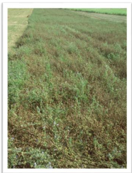
Fot. 4. Plantacja lucerny mieszańcowej RADIUS